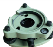
GDF 22 Verde